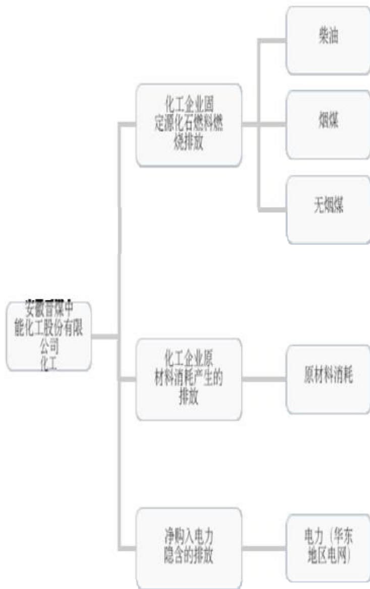
图 3-1 核算边界